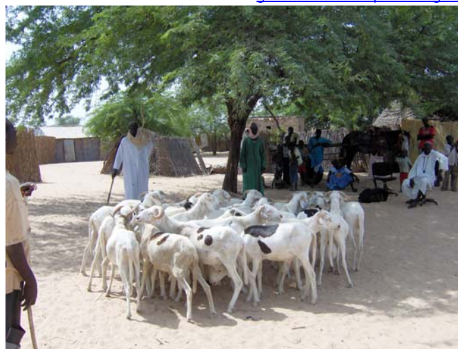
La mandria di montoni allevata a Diakael per la festa di Tabaski

Non avendo a disposizione tutti i fondi necessari, si è studiato insieme ai responsabili senegalesi un progetto d'allevamento (compra vendita di bestiame) in grado, a partire da un capitale iniziale e dal lavoro volontario delle gente del villaggio, di arrivare alla somma necessaria.