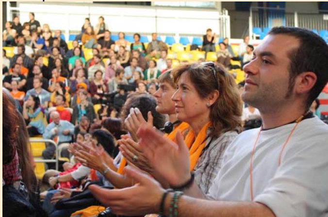
Un momento del Forum Umanista Europeo di Milano

Hanno collaborato a questo numero: (in ordine alfabetico)