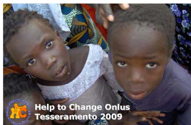
La tessera 2009 di Help to Change

Socio Adottante: contribuisce alle attività di Help to Change con una quota annuale minima di 240 euro, prendendosi in carico uno dei bambini che vivono nelle zone di attività in Africa.